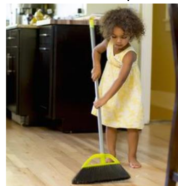
Barrer el piso