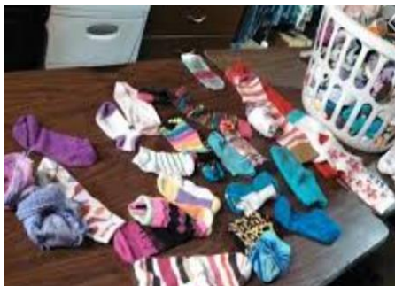
Separar ropa limpia