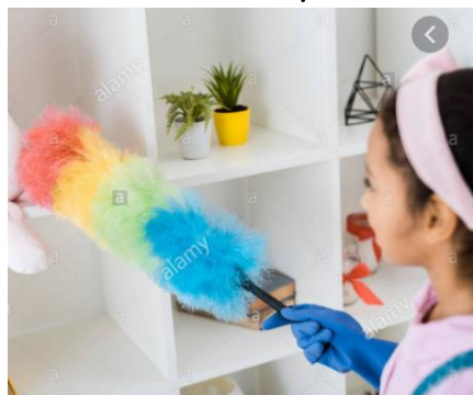
Quitar el polvo