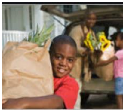
Llevar el mandado