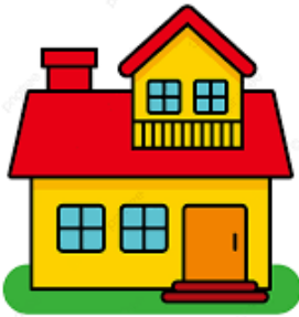
La casa de mamá